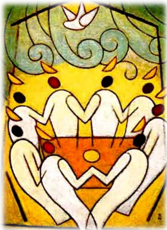
"Сошествие духа" Соичи Ватанабэ, Китай